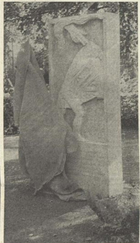
Das neue Mahnmal, das an über 70 KZ-Häftlinge erinnern soll, die auf dem Offenburger Ehrenfriedhof bestattet sind

Als man bei der Stadt den Wunsch hatte, dieses Gräberfeld neu zu gestalten, wußte man nur sehr wenig über die hier bestatteten Toten. Es war nur bekannt, daß auf dem Alliierten-Ehrenfeld Angehörige verschiedenster Nationen bestattet sind, die kurz vor Kriegsende in den Monaten März bis April 1945 in Offenburg verstorben sind. Der ehemalige Friedhofsverwalter Hassis gab über die Bestattung der Toten folgendes an: In der ehemaligen Artilleriekaserne in Offenburg befand sich ein Transport von KZ-Häftlingen, die vorübergehend in Offenburg untergebracht wurden und hier zum Arbeitseinsatz kamen. Im Laufe des Monats April wurden ihm durch SS-Leute tote KZ-Häftlinge gebracht. Bei einigen Toten stellte er keine natürliche Todesursache fest.